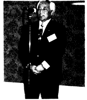
中原副会長 中締め