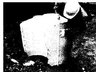
ファーストチューブ先端に詰っていた花崗岩転石 q_u=147\text{N}/\text{mm}^2

現場から採取した花崗岩転石の軸圧縮試験を行ったところ、 q_u=147\text{N}/\text{mm}^2 という結果であった。