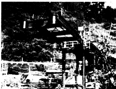
写真1 施工状況写真