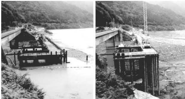
写真1 満水時と干水時

工事名：国道421号線緊急地方道路整備工事 発注者：滋賀県東近江土木事務所 工事場所：滋賀県東近江市 施工者：大豊・大山建設工事共同企業体 工事内容：杭本数63本 杭長11.5～40.0m